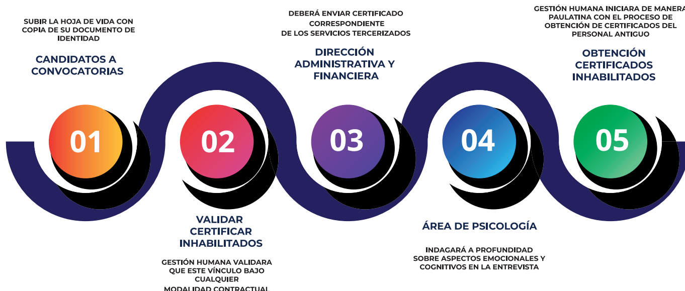
Gráfico 2. Ruta de atención para el reporte y recepción de casos de acoso o violencia